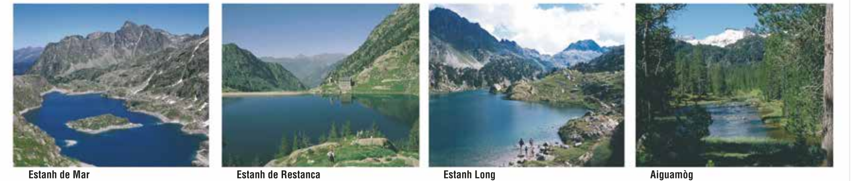
Estany de Mar | Estany de Restanca | Estany Long | Aiguamòg