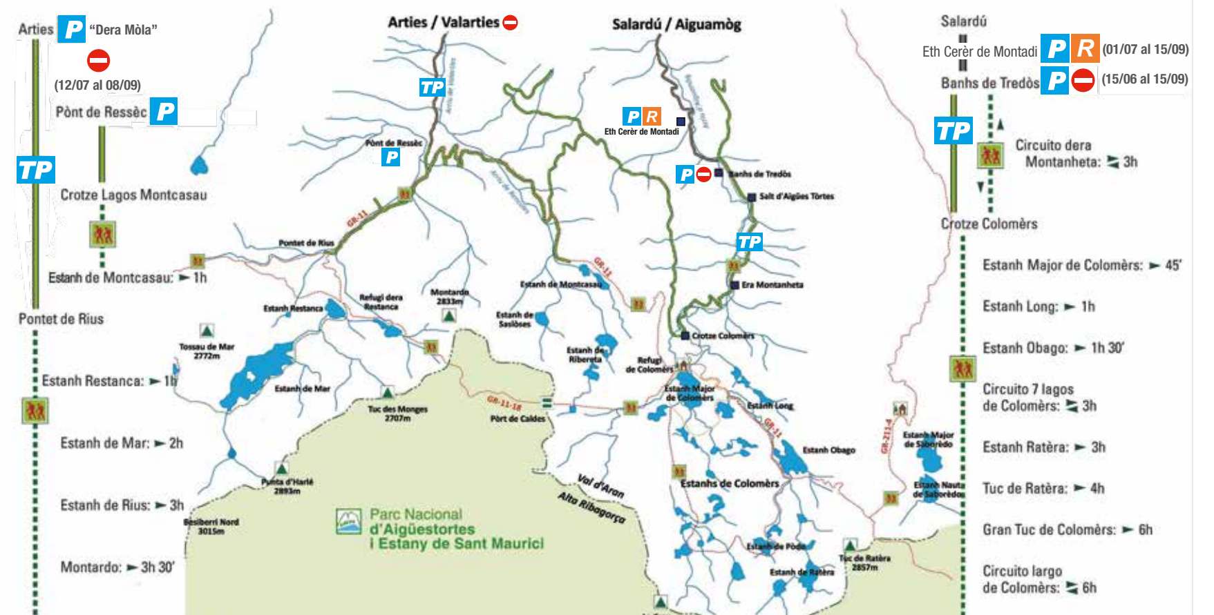
Parc Nacional d'Aigüestortes i Estany de Sant Maurici